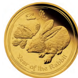
2010年発行の卯年コイン

日本人に馴染み深い「干支」をテーマに2010年の「卯年」から毎年発行されている人気シリーズです。初年度はオーストラリア1カ国が発行する4種類でしたが、近年では5カ国発行の13種類にラインアップが増加。全国の地方銀行・第二地方銀行の約半数で扱われています。また5オンス金貨をはじめとする希少価値の高い大型サイズのコレクションも近年人気を集めています。