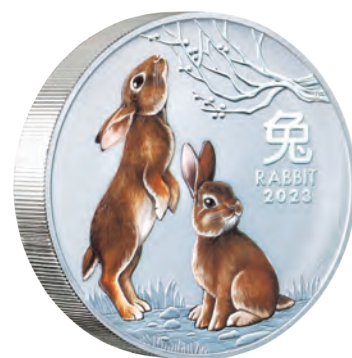
重さ約1kgの30豪ドルカラー銀貨