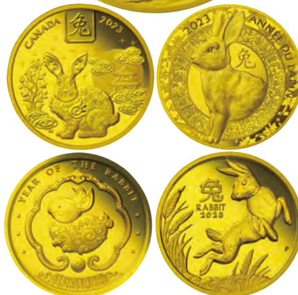
上段/英国・500ポンド金貨(原寸大) 中段/100カナダドル金貨、50ユーロ金貨 下段/1000ニュルタムカラー金貨、100豪ドル金貨