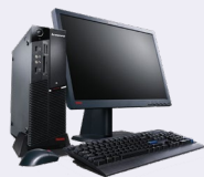
デスクトップ パソコン