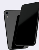
スマートフォン タブレット