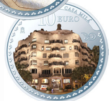
上/10ユーロカラー銀貨<グエル公園>裏面 下/10ユーロカラー銀貨<カサ・ミラ>裏面