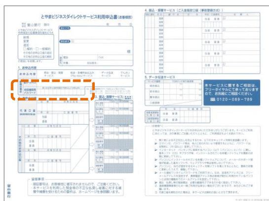
とやまビジネスダイレクトお申込書控

(2) 今後、「とやまビジネスダイレクト」サービスの利用中に使用するID・パスワードをご自身で決めていただき以下の書面に記入ください。