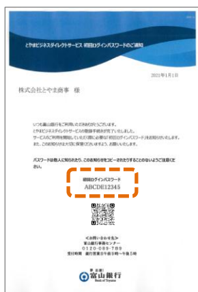
初回ログインパスワードのご通知 (※郵送にてお送りしております)